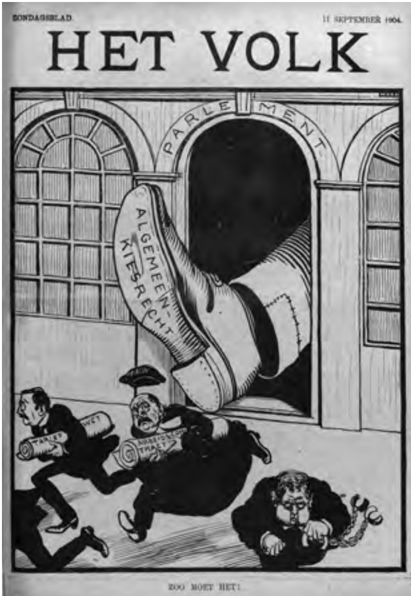
Afb. 6 'Zoo moet het!', spotprent door A. Hahn in Zondagsblad van Het Volk , 11 september 1904.