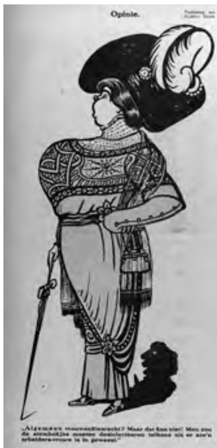
Afb. 9 ‘Opinie’, spotprent door A. Hahn in De Notenkraaker , 22 januari 1911, met onderschrift: ‘Algemeen vrouwenkiesrecht? Maar dat kan niet! Men zou de stemhokjes moeten desinfecteeren telkens als er zoo’n arbeiders-vrouw is in geweest.’ (Universiteitsbibliotheek Amsterdam, Bijzondere Collecties)

En inderdaad had de vrouwenkiesrechtstrijd tot dan toe voor De Notenkraaker geen prioriteit. Bovendien geeft het blad een uitgesproken negatief beeld van de voorvechtsters in de strijd. Zij worden door Hahn steevast weggezet als opgeprikte arrogante dames die hun neus ophalen voor arbeidersvrouwen; de laatste worden in contrast hiermee juist zo gewoontjes mogelijk uitgebeeld, gespeend van iedere vorm van ijdelheid of coquetterie. Dat dergelijke spotprenten eerst vanaf 1907 verschijnen heeft ongetwijfeld te maken hebben met de oprichting in dat jaar van de Nederlandsche Bond voor Vrouwenkiesrecht. De leden, voornamelijk dames uit gegoede kring,