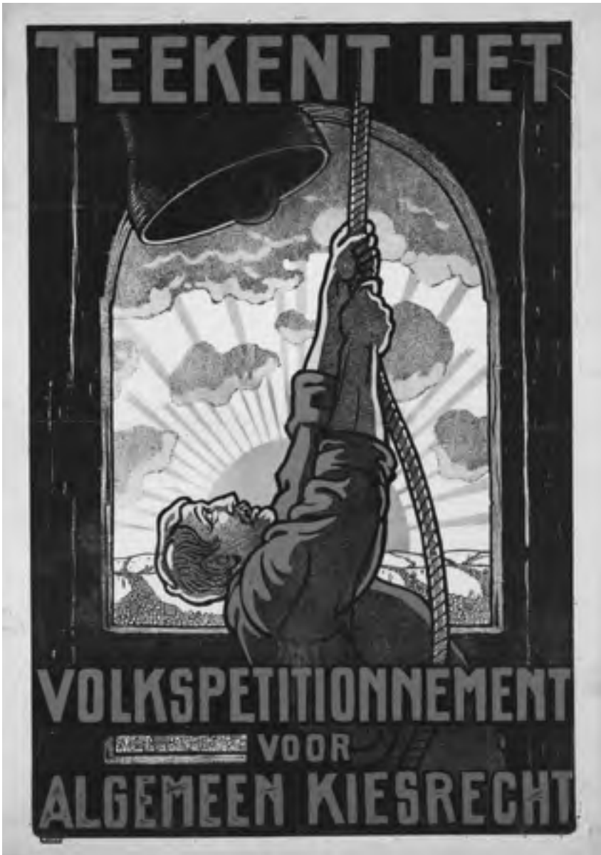
Afb. 7 'Teekent het volkspetitionnement voor algemeen kiesrecht', affiche door A. Hahn, 1911. (Collectie Internationaal Instituut voor Sociale Geschiedenis, Amsterdam)