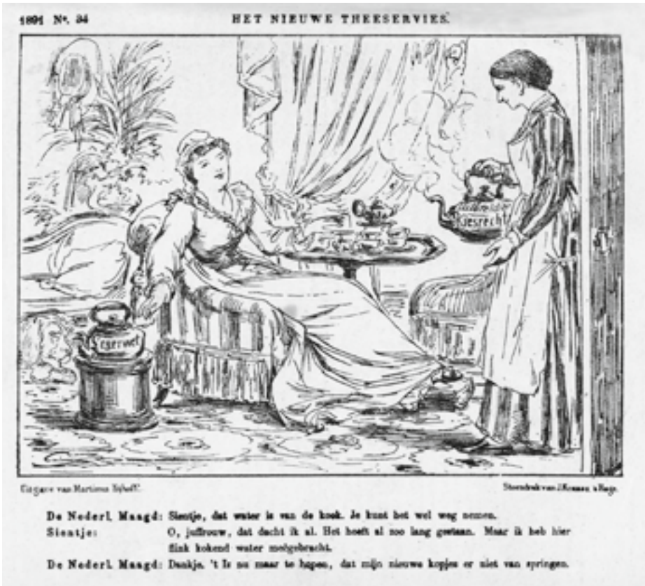
Afb. 3 'Het nieuwe theeservies', spotprent van J.M. Schmidt Crans in De Nederlandsche Spectator , nr. 34, 1891.