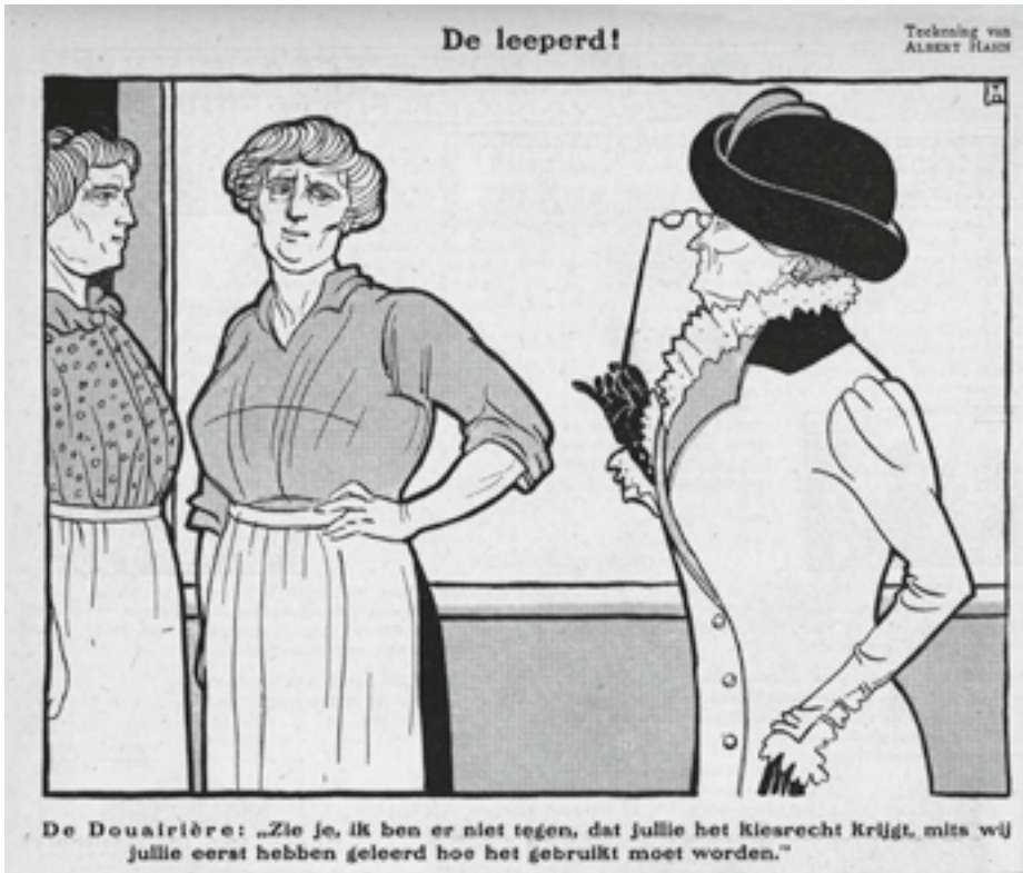
Afb. 10 'De leeperd!', spotprent van A. Hahn in De Notenkraaker , 16 september 1916.

hadden niet het verkrijgen van vrouwenkiesrecht als eerste doel, zoals de Vereniging voor Vrouwenkiesrecht (1894-1919), maar de 'opvoeding tot het verkrijgen van het vrouwenkiesrecht'. Op deze manier wilden zij het maatschappelijk draagvlak voor vrouwenkiesrecht te vergroten. 14 De SDAP beschouwde het streven van de Bond echter als een sluwe truc om arbeidervrouwen uit te sluiten. 'De leeperd!' denken de vrouwen op deze prent van de 'Douairière' die hen minzaam toespreekt met: 'Zie je, ik ben er niet tegen, dat jullie het kiesrecht krijgt, mits wij jullie eerst hebben geleerd hoe het gebruikt moet worden.'