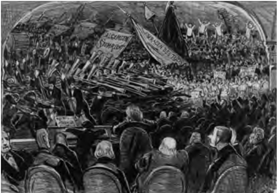
Afb. 2 'Toekomstmuziek - Vox populi, vox Dei' (titels niet in beeld), spotprent door J. Holswilder in De Lantaarn , nr. 19, 1885.

ten, violisten, een pianist, koorzangers en, op de achtergrond, zelfs krijsende babies. Iemand steekt een Jacobijnen muts de lucht in en er wordt gezwaaid met de vaandels 'Algemeen stemrecht' en 'Vragen des tijds', naar de naam van het tijdschrift van de Jonge Liberalen. Rechts onder het midden staan enkele politici te applaudisseren, maar de meerderheid zit onverstoorbaar op zijn stoel. Zij hebben geen boodschap aan het ironisch bedoelde 'Vox populi, vox Dei' onder de prent. De man met de handen tegen zijn oren is de conservatief liberale Minister Jan