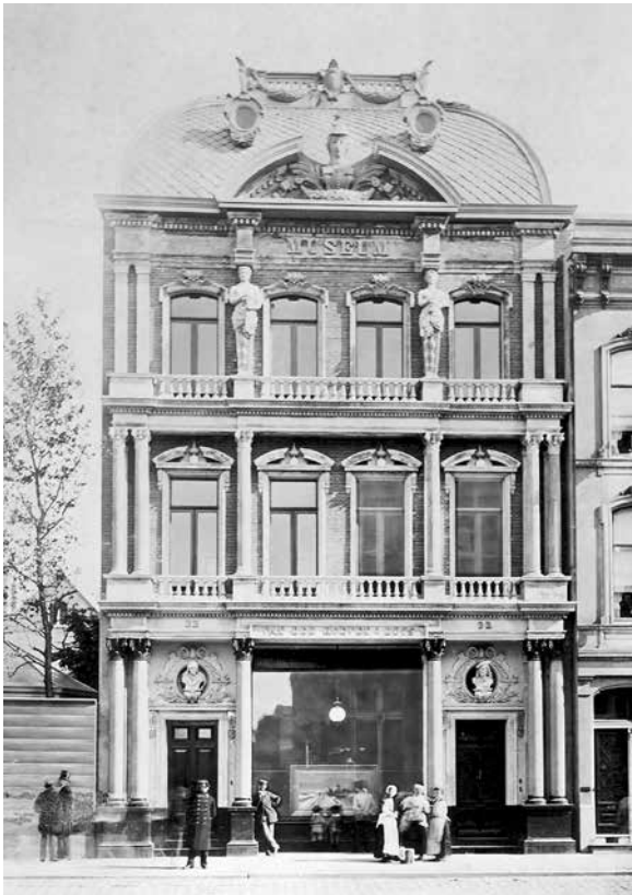
Afb. 1 Het Museum voor Onderwijs en Kunst te Rotterdam. Foto, maker onbekend, 1880. (Stadsarchief Rotterdam, objectnummer XXI 78)

daar hadden deze voorstellingen overigens, naast een wetenschappelijk karakter, geleidelijk aan ook dat van illusionistische theatershows gekregen. 37 Het zal dan ook geen verbazing wekken, dat in de berichtgeving één keer gewag wordt gemaakt van een plan tot het geven populair-wetenschappelijke ‘voorstellingen’ in het Algemeen Schoolmuseum. 38 Dat werd evenwel nooit uitgevoerd.