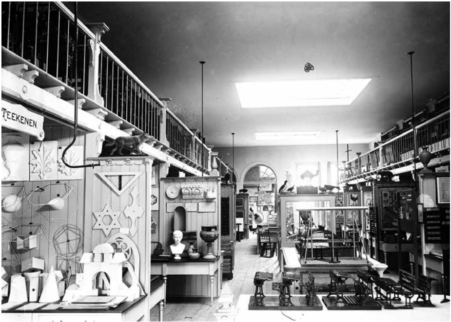
Afb. 4 Interieur Nederlandsch Schoolmuseum te Amsterdam, lange tijd representatief voor ons land (ws. 1894). Glasnegatief, maker foto onbekend. ( Nationaal Onderwijsmuseum te Dordrecht, objectnummer Ho48.001 )

bevolkingsklassen (vooral cilinderhoeden). Ook de dames zijn rijk gekleed. Dit zegt zonder meer iets over de verlangde status van dit museum, want de onderwijzers, als grootste doelgroep, gingen zo niet gekleed. Ten slotte zien we achter in de zaal, achter het bassin, iemand uitleg geven over het tentoongestelde, misschien wel Pieter Harting.