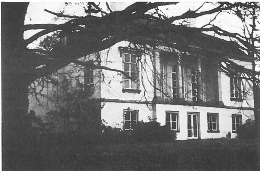
Ewijckshoeve met beuk, gezien vanaf de vijverkant