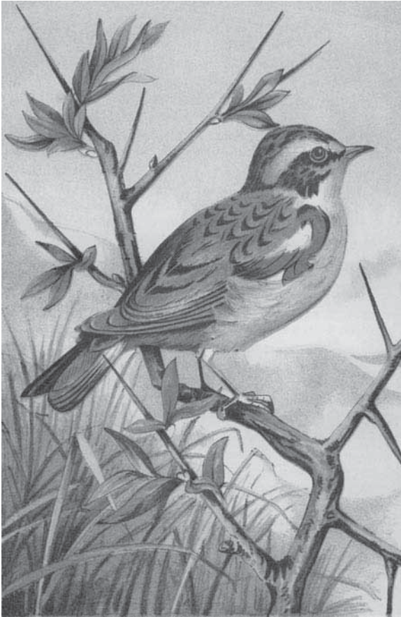
Afb. 3 Paapje ( Pratincola rubetra ). Uit: E. Heimans en Jac.P. Thijssse, In de duinen (Amsterdam 1899) 152-153.