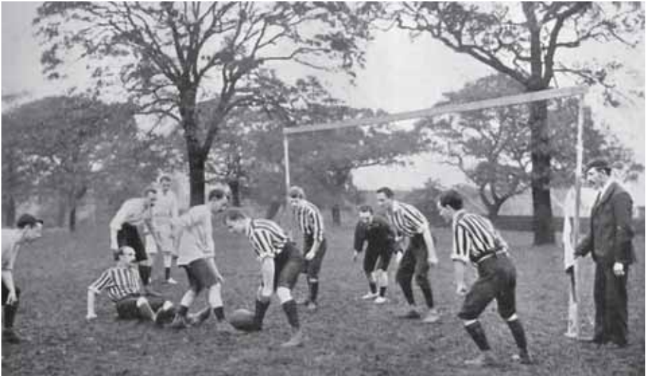
Afb. 4 Ongedateerde afbeelding uit: Charles Alcock, Football. The Association Game (London: Bell, 1897), 30A, met als bijschrift: 'From a photograph by R.W. Thomas. A close dribble. "Ware sharp shot!"'.