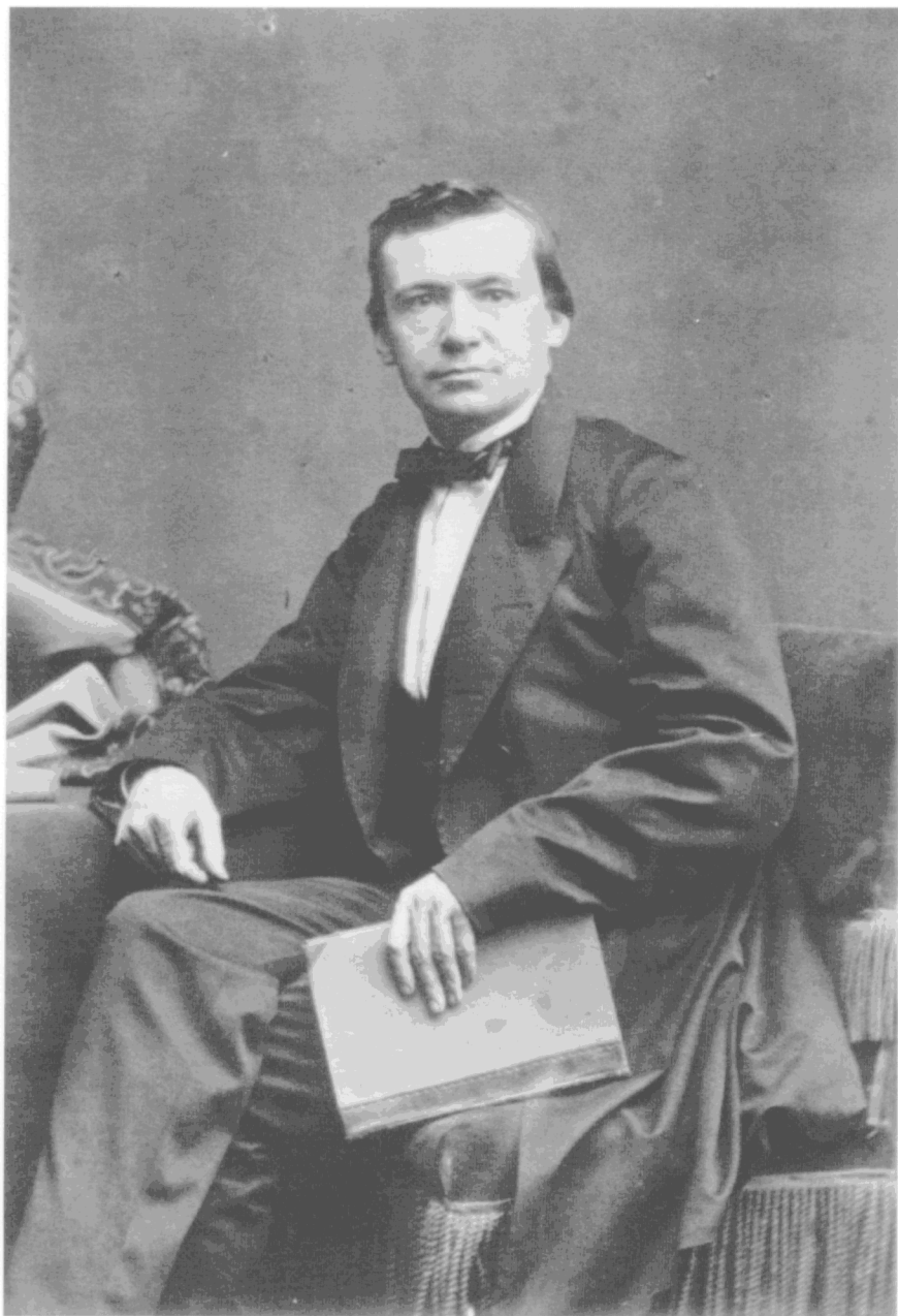
Cd. Busken Huet.