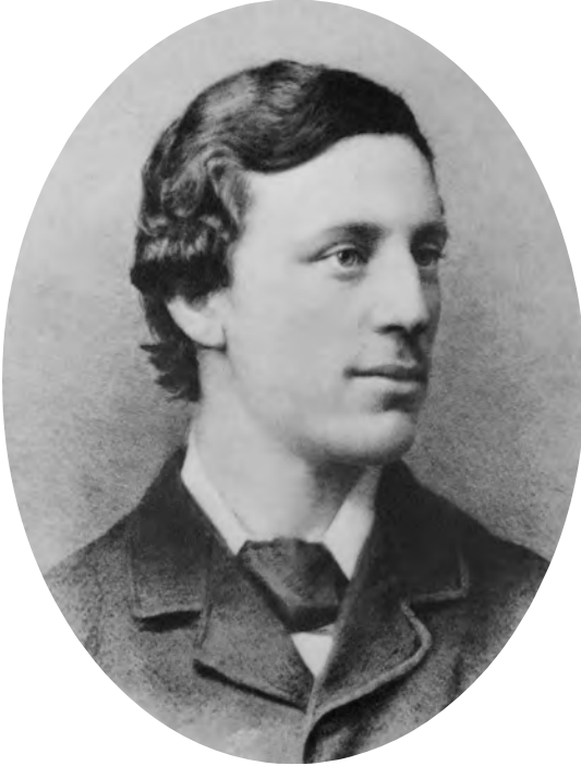
Afb. 1 Arnold Toynbee (1852-1883). ]

ook uit fictionele beschrijvingen kunnen halen, want zelfs in romans speelde het uitoefenen van Toynbee werk, veelal aangeprezen als oplossing voor het ledig bestaan van vrouwen uit de hogere klassen, een rol. 7 Blijkbaar viel het Londense initiatief in vruchtbare aarde: velen hadden er een reis voor over en publiceerden na hun bezoek hun persoonlijke bevindingen.