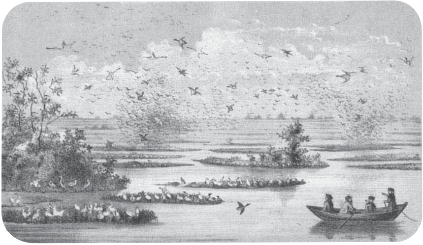
Afb. 1 De wateren rond het Schollevaarseiland zoals weergegeven door Schlegel in diens Vogels uit 1860. Verschillende soorten vogels vliegen in dichte zwermen op bij de nadering van een bootje met bezoekers. Op de voorgrond zijn kleinere eilanden vol met nestelende vogels zichtbaar. Schlegel gebruikte voor dit 'tafereel' in zijn plaatwerk een tekening die de vogelkundige Nozeman rond 1770 bij een bezoek aan het eiland had laten maken.

in het nog iets noordelijker gelegen Naardermeer. 10 Over al deze locaties verschenen natuurjournalistieke bijdragen, waarin de verslaggever steeds aangaf hoe uniek het schouwspel ter plaatse was. Maar bij het Schollevaarseiland en het Horstermeer werd daar nog geen oproep aan verbonden om dit natuurtooneel voor Nederland te behouden en aan het ontginningsproces een grens te stellen. Pas toen de vogels in het Naardermeer voor de derde keer een 'laatste toevluchtsoord' hadden gevonden namen de ontwikkelingen een andere wending. Toen kort na 1900 duidelijk werd dat ook het Naardermeer binnenkort zou worden drooggelegd riep verslaggever Jac. P. Thijsse zijn lezers op om in te grijpen in de gang van zaken. Niet lang daarna zou het Naardermeer inderdaad worden aangekocht door een hiertoe speciaal opgerichte vereniging, om daarmee het eerste natuurmonument van Nederland te worden. Zo werden de lepelaars van het Naardermeer nu het startpunt, en meteen ook een belangrijk beeldmerk van de nieuwe natuurbeschermingsbeweging (afb. 2). 11