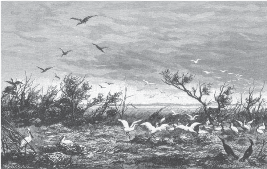
Afb. 4 'Een vogelkolonie aan de Horstermeer. Naar de natuur geschetst en op hout geteekend door W. Roelofs', paginavullende houtgravure in het tijdschrift Eigen Haard , 1880.

Maar rondom al deze toeristische en dierkundige feitelijkheden wordt een groter thema aangesneden: namelijk de vraag wat een wenselijke toekomst zou moeten zijn voor dit gebied, en daarmee ook voor de besproken diersoorten in Nederland. In het Album der Natuur stelde Roelofs dit thema in de opening van het artikel direct nadrukkelijk aan de orde: