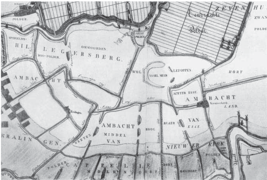
Afb. 3 Plasseengebied tussen Kratingen en Nieuwerkerk, situatie rond 1820. In een lichte kleur zijn de vele voormalige polders zichtbaar die – door uitvening – nu als plassen onder water staan. Het Schollevarseiland steekt als een ronde vorm uit in de ondergelopen Wollefoppenspolder. Het dorp Nieuwerkerk ligt op een T-kruising van dijken temidden van vier plassen rechts op kaart. Veertien van de vijftien plassen ten westen van Nieuwerkerk zouden rond 1870 worden drooggemalen als de nieuwe Prins Alexanderpolder. De twee plassen ten oosten van Nieuwerkerk werden tussen 1830 en 1840 drooggemalen als onderdeel van de grote Zuidplaspolder. Kaart Hoogheemraadschap Schieland, naar weergave bij Brouwer, Historische gegevens, plaat IX.

broedende vogels hier en daar slechts tussenruimten van drie voet open lieten. Hun aantal was, verhaalde hij ons, allengs zeer verminderd. Sommige soorten, die daar vroeger zeer menigvuldig waren geweest, waren geheel verdwenen. Voor drie jaren had hij er den laatsten Schollevaar gezien. Wij moesten ons derhalve op eene teleurstelling onzer hoofdverwachting voorbereiden. 29