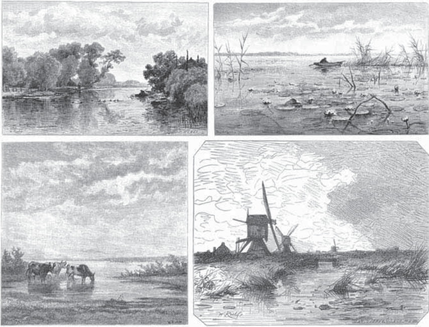
Afb. 5 Houtgravures naar schilderijen en tekeningen van Willem Roelofs, opgenomen in het tijdschrift Eigen Haard tussen 1876 en 1882. De vijf 'kunstplaten' van de hand van Roelofs die in deze jaren verschenen (zie ook afb. 4) tonen alle een landschap met open watervlakke, in de vorm van een plas of brede watergang. Met de klok mee vanaf linksonder zijn weergegeven: 'Hollandsch Landschap', 1876; 'Hollandsch Landschap', 1879; 'Waterleliën' 1881; 'Watermolens' 1882.