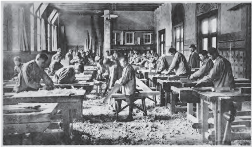
Afb. 2 Timmerwinkel 2e klasse, ambachtsschool Haarlem, ongeveer 1900.

het ambacht, zoals ‘kennis van grondstoffen, bouwstoffen, gereedschappen en werktuigen’. 13 Zaaijer zag deze twee vormen van onderwijs als strikt gescheiden circuits. De overheid bleef niet doof voor deze pleidooien, want begin jaren negentig werd besloten om de ambachtsscholen te subsidiëren, echter alleen als aanvulling op de particulier bij elkaar geschaapte gelden. 14 Het accent bleef zo sterk liggen op het particulier initiatief.