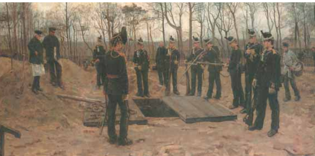
Isaac Israëls, Militaire begrafenis, 1882, olieverf op doek, 126 x 261 cm (Gemeentemuseum Den Haag).

De schilderijen die Isaac Israëls aan het begin van zijn loopbaan maakte van het militaire leven zijn gespeend van iedere heroïek en doen daardoor waarheidsgetrouw aan. Er liggen echter wel verscheidene voorstudies aan ten grondslag (uit: cat. tent. De schilders van Tachtig. Nederlandse schilderkunst 1880-1895, Zwolle/Amsterdam 1991).