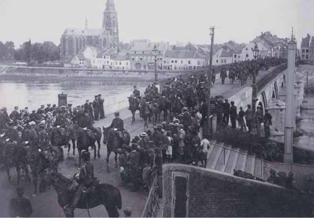
Tijdens manoeuvres in Limburg in 1901 trok een deel van de militairen onder grote publieke belangstelling door Maastricht.

In de negentiende eeuw wilde het Nederlandse leger zich verdedigen in de zogeheten Vesting Holland, die haar kracht aan onderwaterzettingen moest ontleenen.