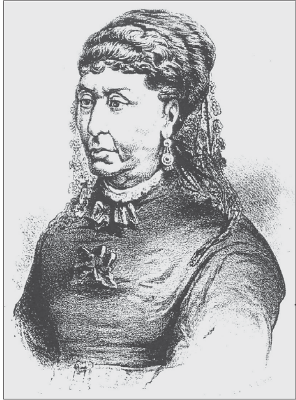
Afb. 2 Portret van George Sand: lithografie naar een van de beroemde foto's van Nadar, afgedrukt in het Leeskabinet in 1876.