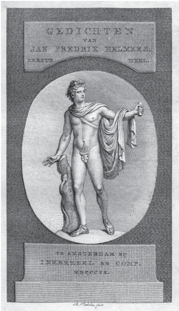
Afb. 1 Titelpagina van Helmers' Gedichten, dl. 1 , Amsterdam 1809. Bijzondere collecties, Radboud Universiteit Nijmegen.

In de gedichten uit de jaren 1795-1813 is vaak dezelfde anti-Franse grondtoon te ontwaren, met als hoogtepunt zijn epische bejubeling van het vaderland, De Hollandsche natie . Dit gedicht staat bol van de anti-Franse toespelingen. Helmers werkte er meer dan tien jaar aan: al in 1802 droeg hij er delen uit voor in Concordia et Libertate en Felix Meritis . 7 De centrale motieven in dit gedicht – de anti-Franse stemming, de teloorgang van het vaderland en de troostrijke herinnering aan een roemrijk verleden – zijn in feite kenmerkend voor zijn gehele poëtische oeuvre.