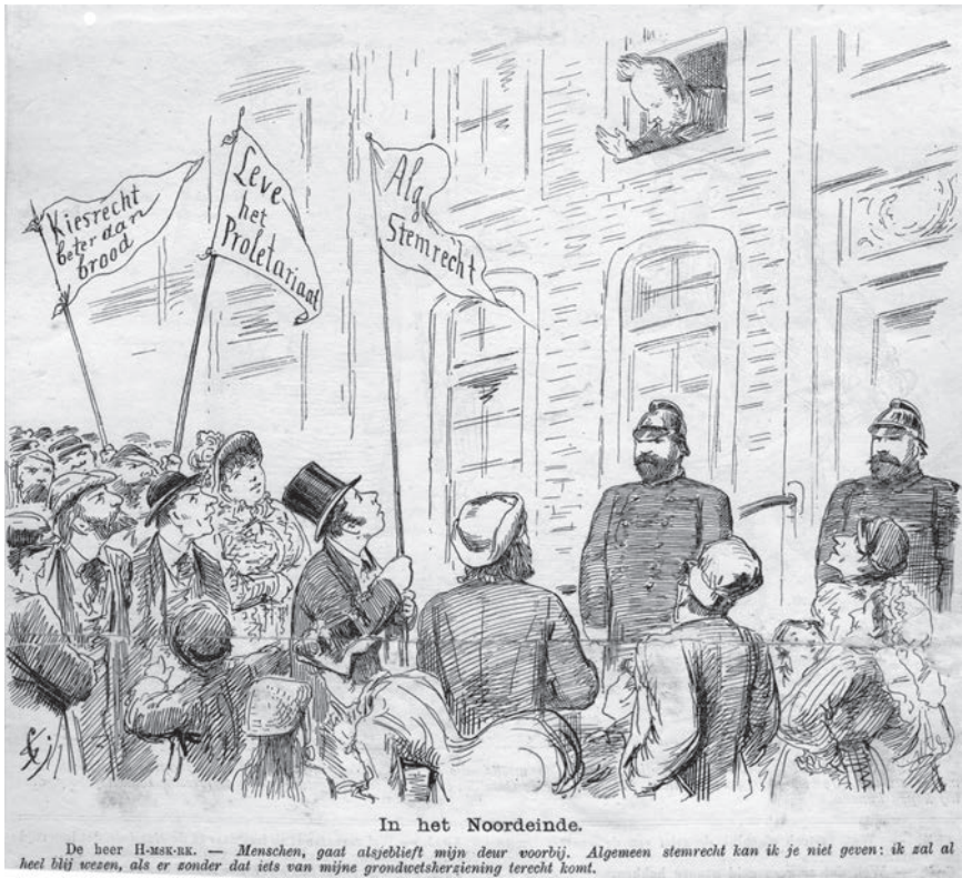
Afb. 1 J.M. Schmidt Crans, Volks-betoging op 19 september (1885)

van de liberalen gemaakt. Het socialisme kwam voort uit het liberalisme en de liberale pers maakte zich door 'de bandeloze taal van de sociaaldemocraten in haar kolommen over te nemen (...) tot bondgenote van de sociaaldemocraten, die zij zegt te bestrijden'. 51 Hierdoor werd het zeggen en doen van socialisten ook buiten 'zeer engen kring' bekend. Bovendien deed dit afbreuk aan het rechtsbesef van de bevolking doordat 'men bij het volk de gevaarlijke dwaling aan [kweekt], dat dit strafbare geoorloofd is'. 52