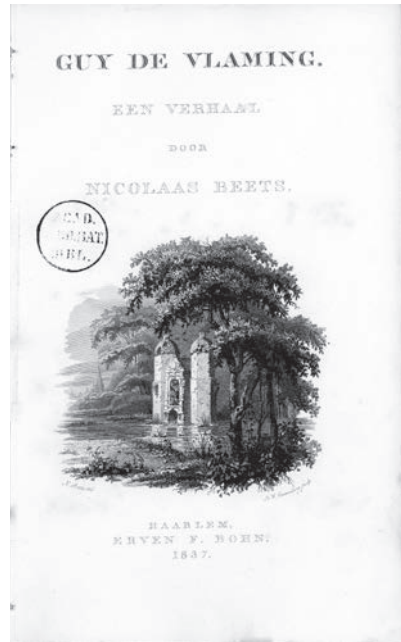
Afb. 4 Nicolaas Beets, omslag Guy de Vlaming . (Haarlem 1837). DBNL.

Beets zal er niet wakker van hebben gelegen. Hij was in korte tijd in het middelpunt van de belangstelling komen te staan en groeide uit tot een gerespecteerd lid. Op 23 januari 1840 sprak hij zelfstijdens een openbare – enkel aangeregenommeerde sprekers toevertrouwde – vergadering, toen hij in Leiden zijn Ada van Holland