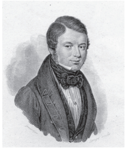
Afb. 3, Portret van Nicolaas Beets als student (1814-1903).