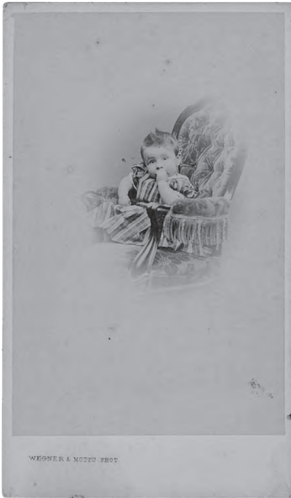
Afb. 1 Foto van Gideon Boissevain op eenjarige leeftijd (1864), SAA, 394, inv.nr. 608.