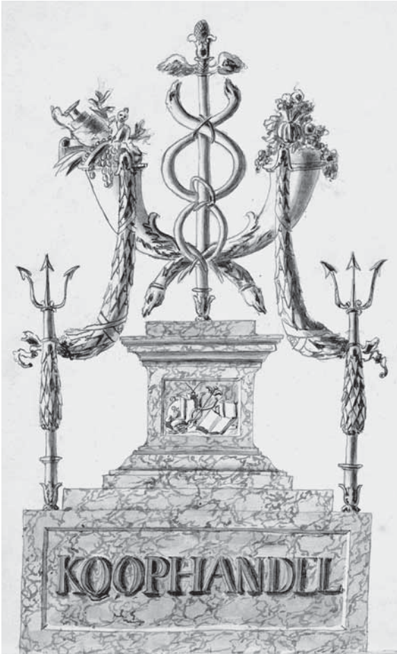
Afb. 3 Decoratie met het thema Koophandel, verbeeld door een trofee met een Mercuriusstaf, hoornen van overvloed, drietanden en guirlandes. Deze sokkel werd opgericht op de Herengracht, ter gelegenheid van het bezoek van de prins en prinses van Oranje aan Amsterdam op 19 september 1816. Collectie Rijksmuseum Amsterdam, Objectnummer RP-T-00-3860.

tussen eigenbaat en nijverheid weet te vinden hoeft luxe geen bedreiging te vormen, noch voor hemzelf, noch voor de samenleving. Voor de negentiende-eeuwse dichters is deze spanning op een ander niveau komen te liggen. Het debat over de bedreigende aspecten van weeldezucht heeft zijn urgentie verloren. In het verarmde Nederland van de na-Napoleontische tijd is weeldezucht niet de meest opvallende keerzijde van de doux commerce . Het ideaal wordt veeleer ondergraven door de 'zwarte geschiedenis' die steeds moeilijker te negeren blijkt: de handel is evident ook de motor geweest van tal van allesbehalve beschaafde verschijnselen als moordende concurrentie, handelsoorlogen, uitbuiting en slavernij. In Commerce and its discontents laat A.F. Terjanian, onder meer via een analyse van Raynals eerder genoemde Histoire des deux Indes en de receptiegeschiedenis daarvan, zien dat het ideaal van de doux commerce al in