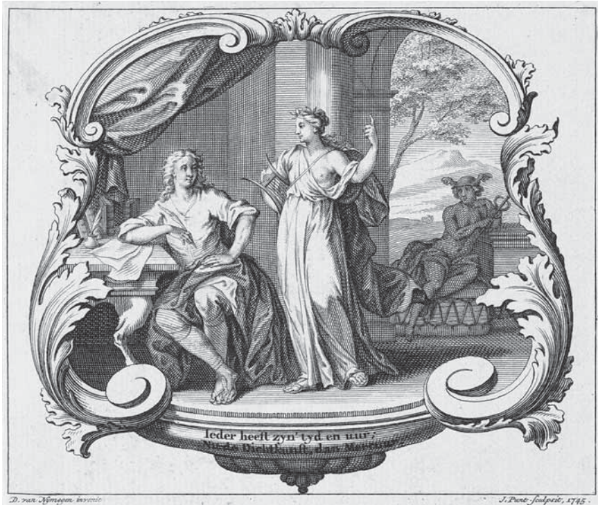
Afb. 2 Jan Punt (naar ontwerp van Dionys van Nijmegen), Vignet met Poëzie en Mercurius. ‘Ieder heeft zyn tyd en uur; Nu de Dichtkunst, dan Mercurius’ (Amsterdam 1745). Collectie Rijksmuseum Amsterdam, RP-P-OB-66.246.

beschouwingen. 83 Met name enkele uitspraken van Montesquieu in l’esprit des lois zouden verantwoordelijk zijn voor een brede verspreiding. 84