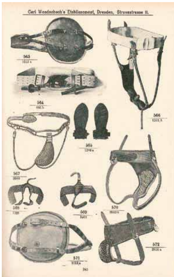
Afb. 1 Een pagina uit een medische catalogus met anti-onaneergordels voor zowel mannen als vrouwen (nr. 567: ‘Onaniebandage meiner verbesserten Konstruktion, m. Rücken-schloss, männlich’, nr. 570 en nr. 572: ‘Eine Onanie-bandage männliche oder weibliche, für Kinder’) en ‘Onanie-Schutzhand-schuhe mit Ledersohlen’ (nr. 565). Hauptkatalog der Firma Carl Wendschuch (Dresden 1910), 245.

chamelijk gezien was er echter voor mannen een extra risico. Dit had te maken met de doorwerking van de humeurenleer, waarbij de vier lichaamsvochten (‘humores’ of temperamenten: bloed, slijm, zwarte gal en gele gal) in balans moesten zijn. Zaad werd samengesteld uit de ‘humores’ en was een van de belangrijkste lichaamsvochten. 47 Tissot stelt: ‘Bij het verliezen des zaads verliest men terzelfder tijd de levensgeest.’ 48 Dit komt volgens Tissot omdat bovenmatige vocht-